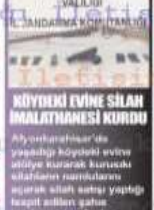
Afyonkarahisar'da yaşadığı köydeki evine silah ihalatnamesi kurdu. İlçe Jandarma Komutanlığı tarafından düzenlenen ihalatnamesi kurdu. İlçe Jandarma Komutanlığı tarafından düzenlenen ihalatnamesi kurdu.