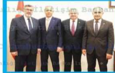
Afyonkarahisar AK Parti Milletvekilleri Ali Özkaya, İbrahim Yurdunuseven, Hasan Arslan İçişleri Bakanı Ali Yerlikaya'ya TBMM'de ziyaret etti.

Gerçekleştirilen ziyaret kapsamında Afyonkarahisar'da devamlı olarak yapılabilmek için hükümet konularını inşaatları ve diğer yatırımlar üzerine yönelik bir görüşme gerçekleştirildi. AK Parti