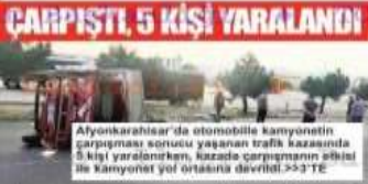
Afyonkarahisar'da otomobile kamyonetin çarpması sonucu yaşanan trafik kazasında 5 kişi yaralanan, kazada çarpmasının etkisi ile kamyonet yol ortasına devrildi.>>3TE