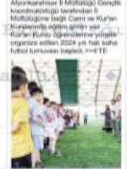
Afyonkarahisar İ Millî Eğitim Müdürlüğü Gençlik Koordinatörlüğü tarafından düzenlenen Kur'an Kursu öğrencilerinin futbol turnuvası sona erdi. Turnuvalarda öğrencilerin sportif ve sosyal becerilerini geliştirme amaçlı olarak düzenlenen turnuvaların düzenlenmesi için çalışmalar yapılmaktadır. >>4TE